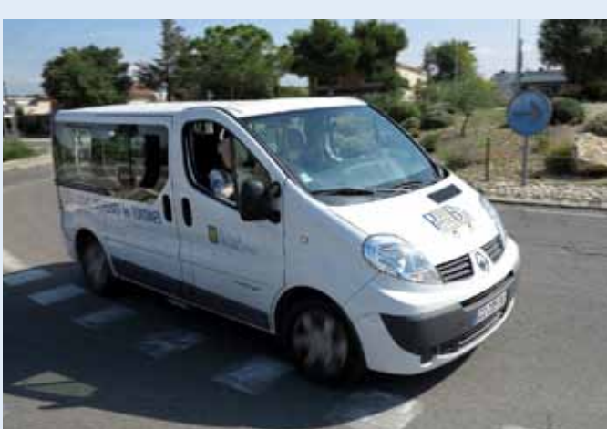
Contact C.C.A.S : 04 90 61 45 05 - ccas@perneslesfontaines.fr

Et aussi : une senior bénévole signale les rendez-vous quotidiens à découvrir sur la webradio gratuite "Haut Parleur" avec des jeux, des séances de relaxation, des rendez-vous musique rétro...