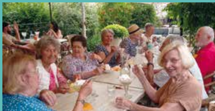
Instant de convivialité et de douceur glacée en bord de Sorgue sous une terrasse ombragée.