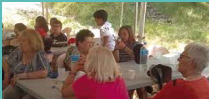
Pique-nique intergénérationnel. En juin, les seniors ont retrouvé les enfants de l'ALSH (8 - 11 ans) au Conservatoire de l'abeille noire.