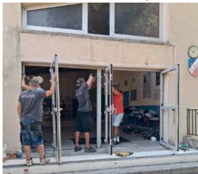
Ecole élémentaire Jean Moulin

À l'école des Valayans, une pompe à chaleur avec système réversible (chaud/froid) modernise le mode de chauffage au fioul devenu obsolète et de nouvelles menuiseries renforcent le gain énergétique. Des travaux d'isolation de la façade nord programmés de longue date vont être entamés.