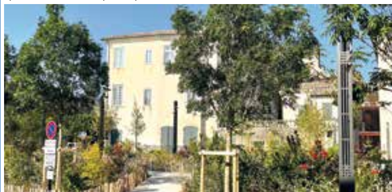
Îlot de fraîcheur cet été place Rose Goudard à L'Isle s/Sorgue

Des communes voisines ont montré l'exemple en végétalisant leur centre urbain et en créant des îlots de fraîcheur. Ne soyons pas la dernière à agir ! Protéger le patrimoine historique, c'est bien, mais permettre aux Pernois de mieux supporter les conséquences des canicules, c'est essentiel. Une question de santé publique !