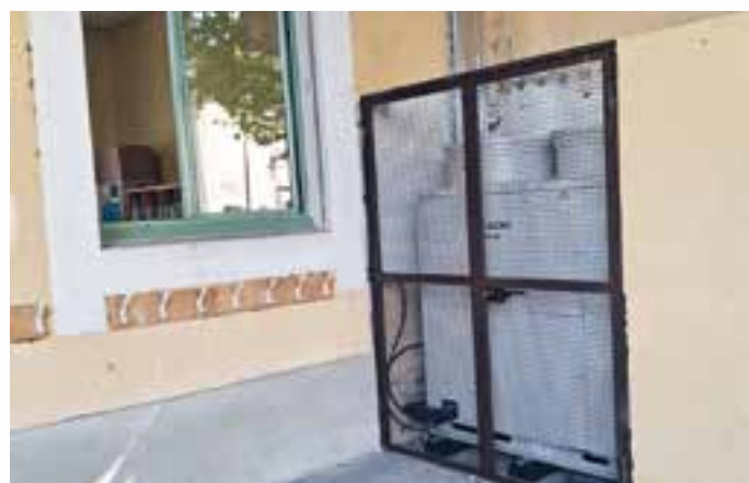
Ecole des Valayans

La rénovation énergétique des écoles est prise en charge par la ville de Pernes-les-Fontaines et subventionnée en partie :