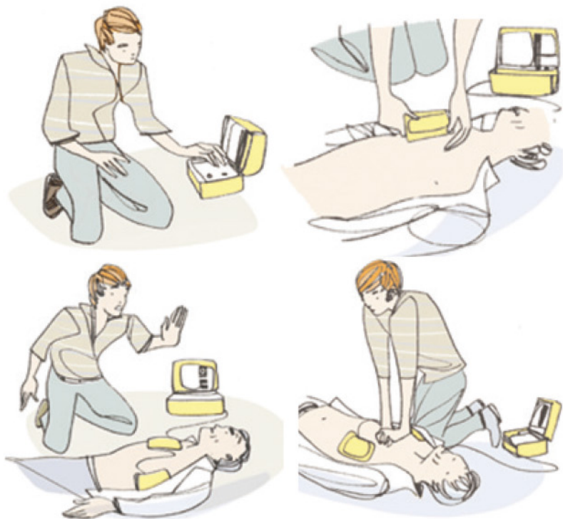
Illustrations : Philippe Diemunsch - site la Croix Rouge

« LE MASSAGE CARDIAQUE NE RÉANIME PAS, MAIS LE DÉFIBRILLATEUR OUI »